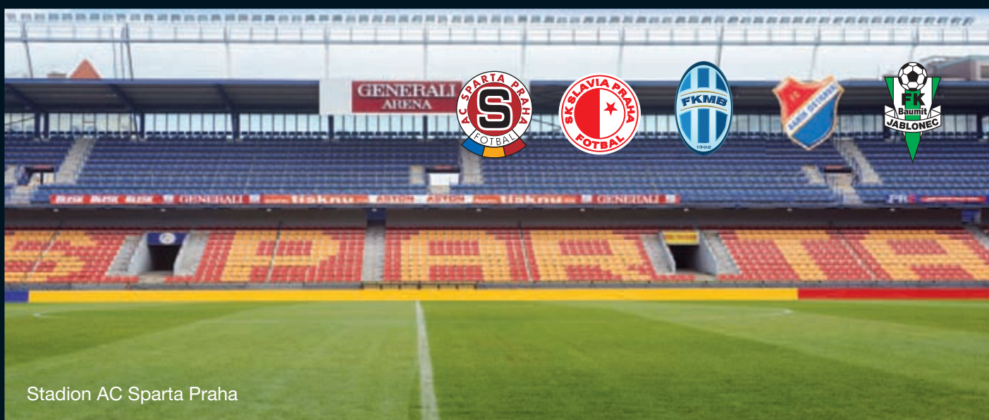
Stadion AC Sparta Praha