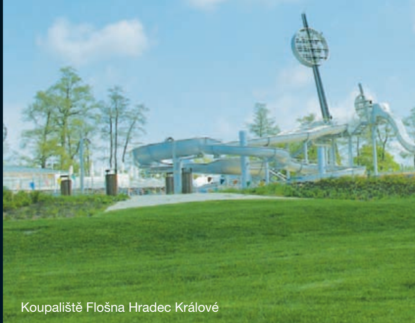
Koupaliště Flošna Hradec Králové