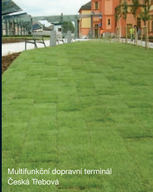
Multifunkční dopravní terminál Česká Třebová