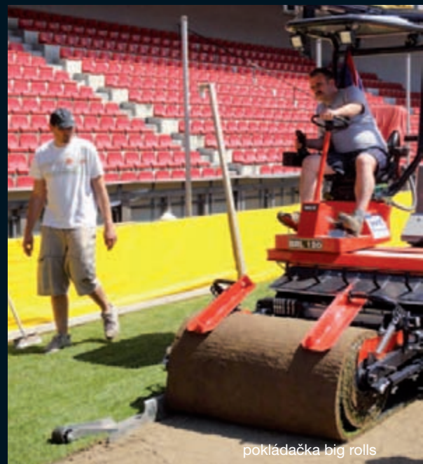
pokládačka big rolls