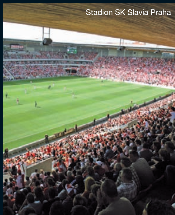
Stadion SK Slavia Praha