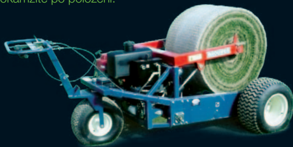
pokládačka středních rolí

Pokládka big-rolls rolí se využívá na velkých rovných plochách o minimální výměře 3 000 m 2 . K tomuto typu jsme schopni zajistit službu profesionální pokládky specializovaným strojem, který vlastnime jako jediní v ČR. Pokládka je velice rychlá (až 400 m 2 za hodinu) a kvalitní. Na ploše je minimum spár a trávník se dá využívat okamžitě po položení.